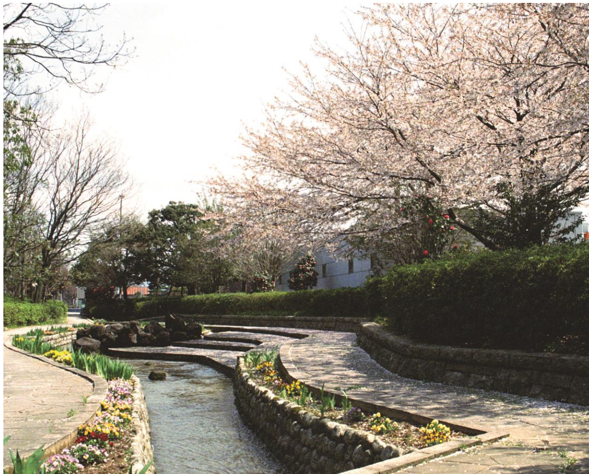
松任総合運動公園