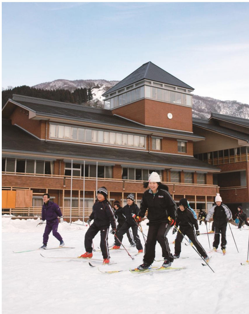
山のすぐ近くに位置する学校