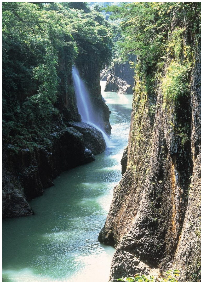
手取峡谷