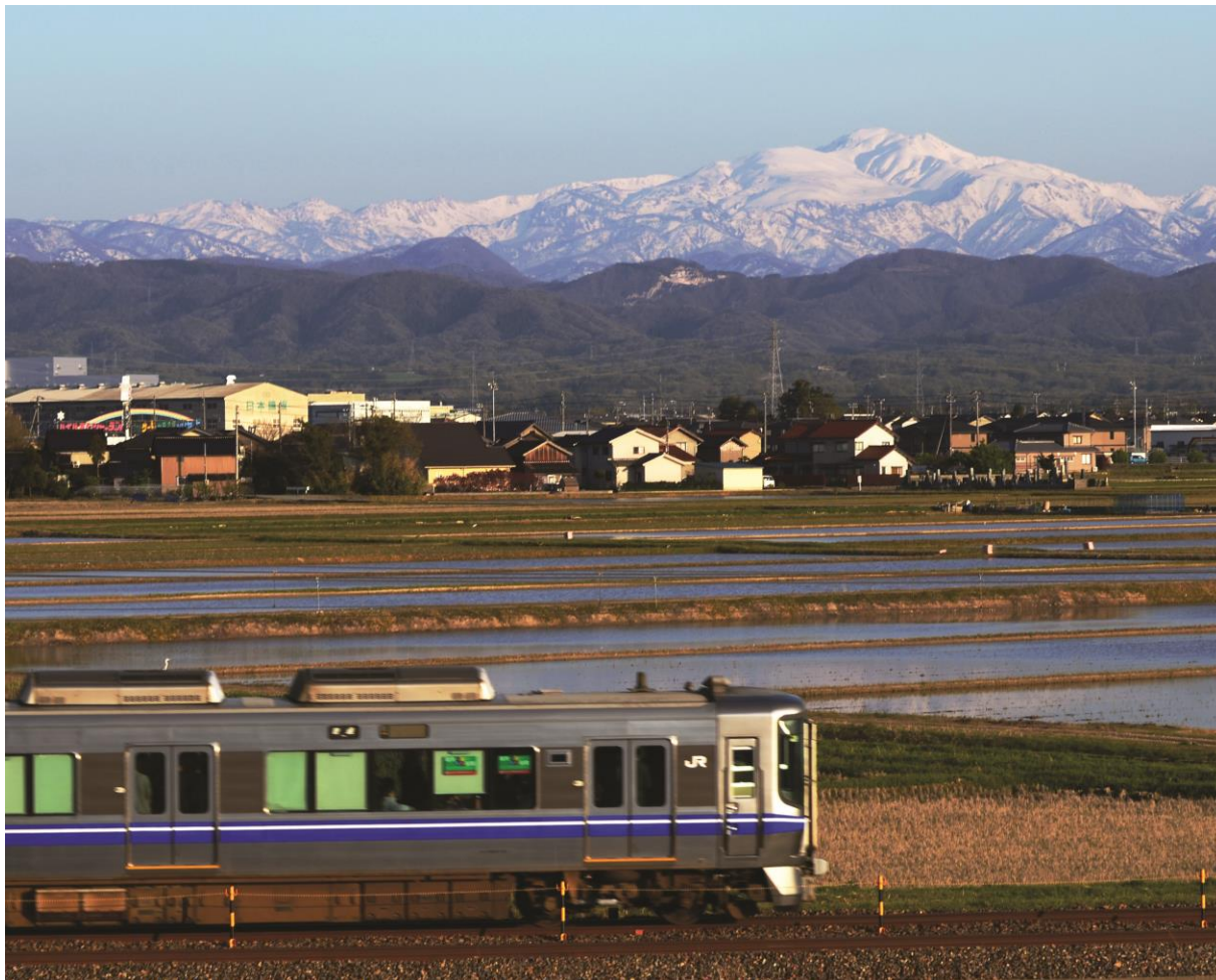
松任市の春の景色