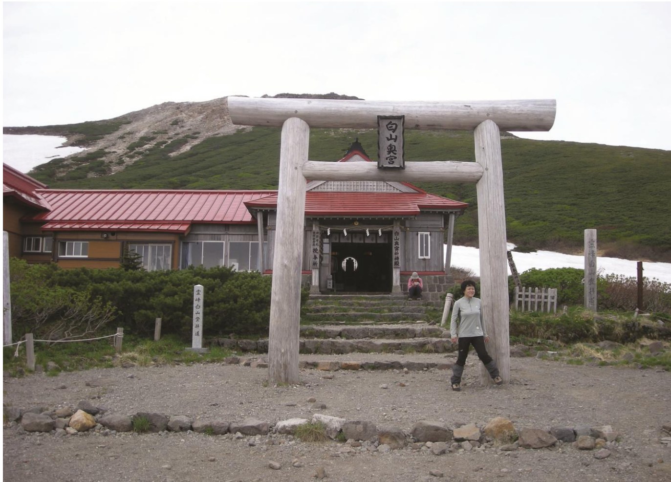
白山神社奥宮（白山の頂上）