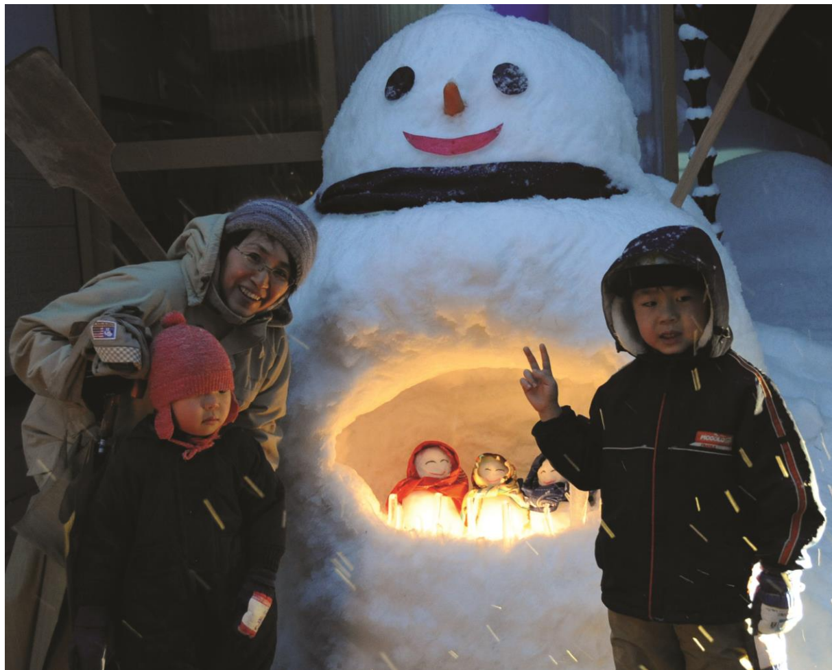
白峰雪だるま祭り