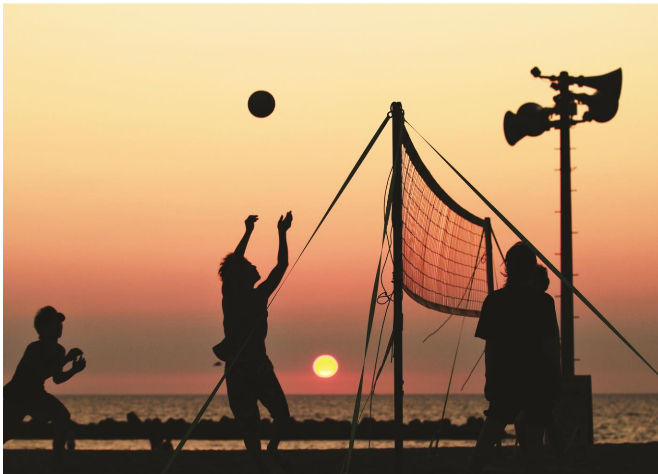
松任海岸の夕焼け