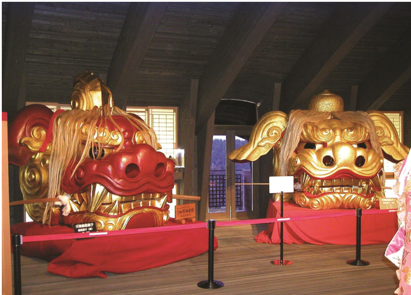
獅子ワールド館にて展示されている獅子頭