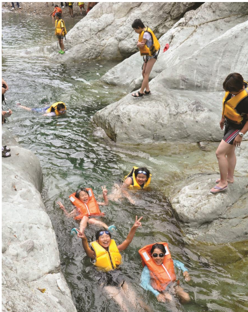
ウォーターパーク