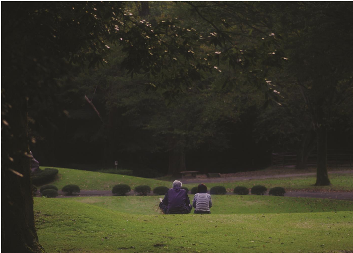
白山ろくテーマパーク