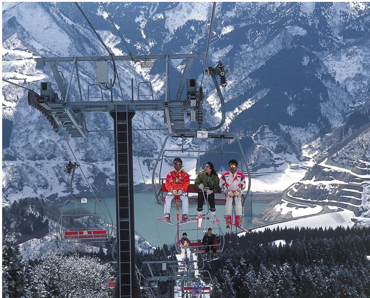
白山スキーリゾート