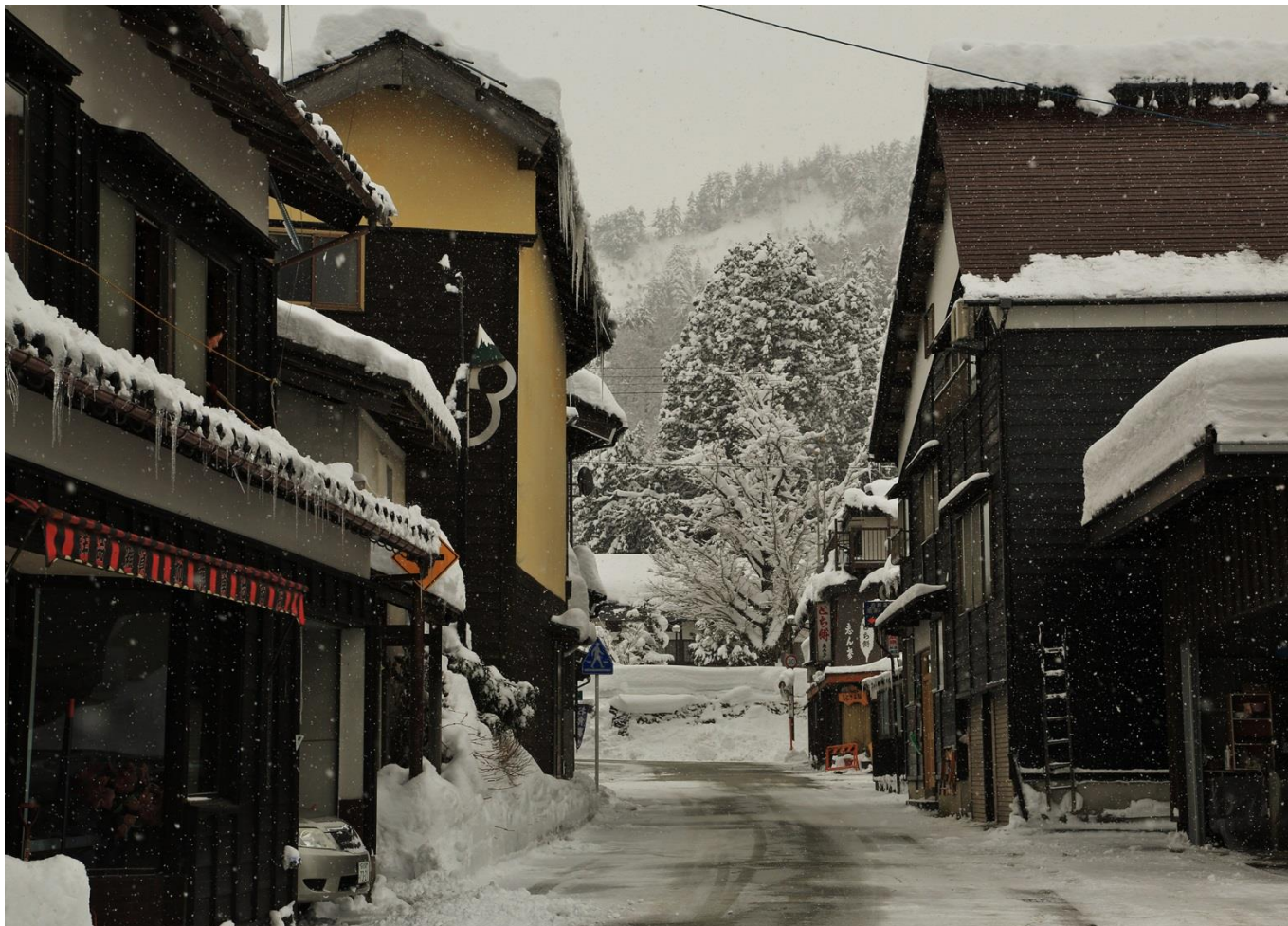
伝統的な白峰地域