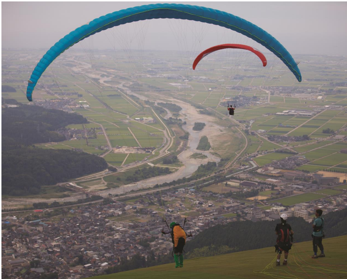
獅子吼高原からの景色