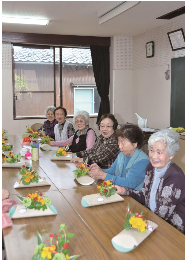
生け花を楽しむ白山のシニアの方々