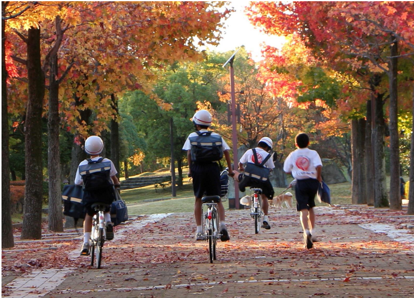
松任総合運動公園