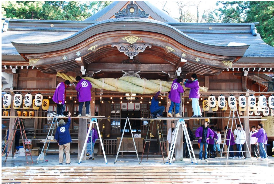
正月に向けて新しい注連縄へと変えている様子

松任市の写真同好会のメンバーは、“私たちが住んでいる町、愛している町、働いている町、学んだ町、そして遊んだ町”をテーマに撮った写真を私たちにを見せてくれた。これらの写真は2013年10月に白山市の人々がコロンビアを訪れていた間、コロンビア市役所内にて飾られ誰でも見ることができた。