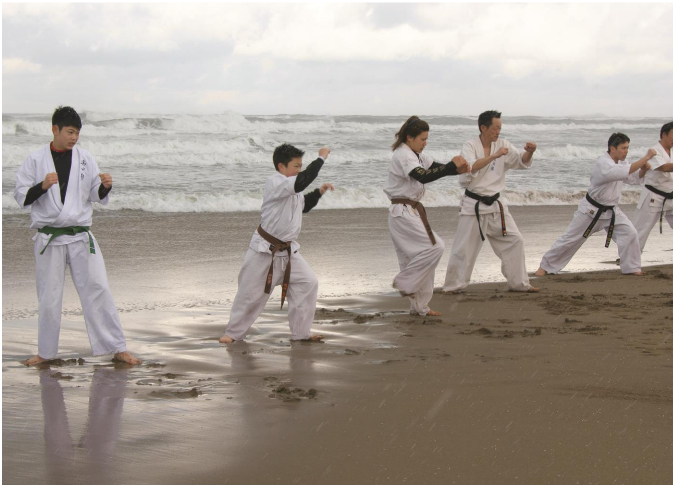
冬の松任海岸で空手の練習をする子供達